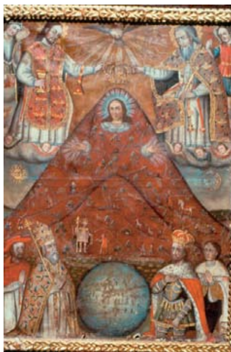
Figura 5. Anónimo. La Virgen-Cerro. Museo de la Moneda, Potosí.

En un lienzo con la misma composición, fechado en 1720, hoy en el Museo Nacional de Arte (La Paz) el Emperador Carlos V y el papa Pablo III fueron sustituidos por el papa y el monarca correspondientes. Existen un total de cinco composiciones sobre este asunto, lo que indica