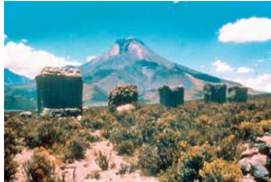
Figura 6. Vista del volcán Sabaya, Departamento de Oruro. View from the Sabaya Volcano, Department of Oruro.

se sabe que en el siglo XVII el pueblo edificado a los pies del Sabaya desapareció. Es posible que la erupción del Sabaya sea coincidente con la del Omate. Los agustinos entronizaron la Virgen de la Candelaria en Sabaya para sustituir el culto al volcán. El santuario tuvo su apogeo en el siglo XVIII, cuando el pintor indio Luís Niño divulga, por medio de sus cuadros, la imagen de la Virgen de Sabaya (Figura 7).