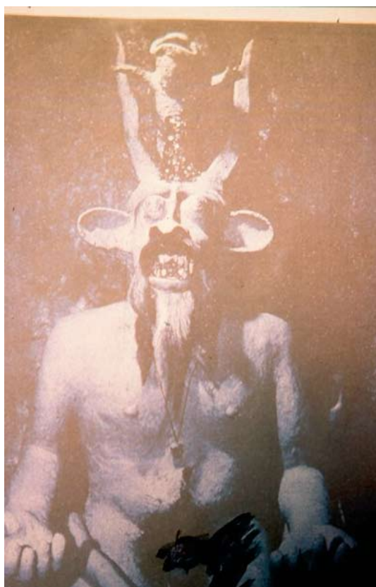
Figura 2. El “Tío” de la mina. The Protector of the mine.

El cerro de Potosí no es el único caso en que un ídolo antropomorfo se identifica con un cerro o “ apu ”, el caso de Pucarani es similar. Al respecto Alcedo (1967) en su Diccionario dice, refiriéndose a Pucarani: