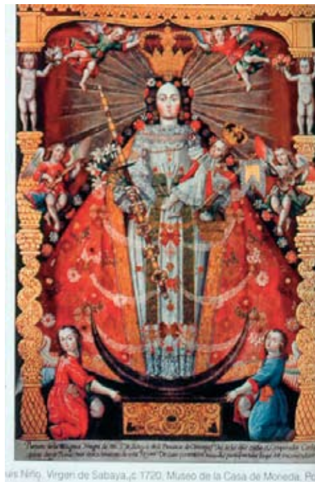
Figura 7. Luís Niño. La Virgen de Sabaya que sustituye al volcán de su nombre. Adorado por los indios Carangas. Museo de la Moneda, Potosí.

Luís Niño. The Virgin of Sabaya who substitutes the volcano that carried her name. It is adored by the Carangas Indians (Mint Museum, Potosí).