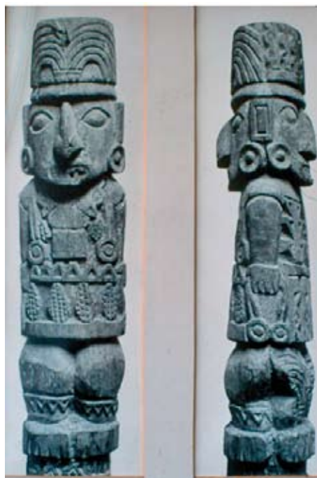
Figura 3. La imagen de madera que representa al dios Pachacámac. Museo de sitio en Pachacámac. The wooden image that represents the god Pachacámac. Archaeological Site Museum of Pachacámac.

Según Menzel (1968) el estilo cerámico encontrado en Pachacámac corresponde a la cultura Huari y por tanto los restos ceremoniales relacionados con Pachacámac deben datarse en el Horizonte Medio, después del siglo VIII de nuestra era y antes del siglo XII. Vale decir, que son anteriores a los incas; estos respetaron el templo de Pachacámac y construyeron otro dedicado al Sol. En el antiguo templo se encontró una imagen bicéfala, tallada en un alto poste de madera. Allí se muestra el anverso y reverso de un mismo ser diferenciado tan solo por sus atributos (Figura 3). En uno de los lados el personaje se viste con mazorcas de maíz, identificables con el día y el sol, concepto que se refuerza con la conquista de los incas (Eeckhout 2004:497). En el otro lado tiene dos peces y en el torso cabezas de zorro, animal relacionado con la noche. Se muestran así las dos fases antagónicas del mito de Pachacámac. Es un dios con doble rostro.