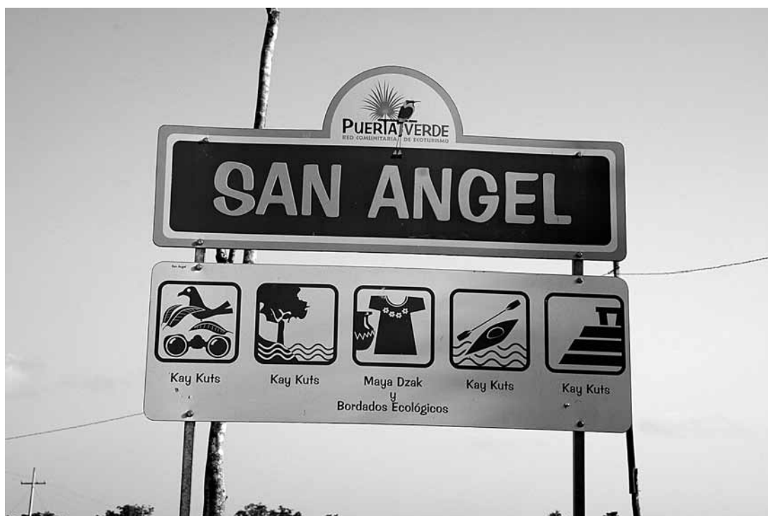
Figura 4. Anuncio de Puerta Verde fuera de la comunidad de San Ángel. Puerta Verde sign outside of the community of San Ángel.

que forma parte de la porción norte del protegido Arrecife Mesoamericano (Yum Balam 2010). La oficina principal de esta reserva se ubica en Cancún pero tiene un par de botes patrulla y representantes locales en Chiquilá y Solferino. Mientras que la reserva fue importante para fundar Puerta Verde y es promovida en su página web, Yum Balam parece tener escasa infraestructura turística y nada de turismo relacionado con los sitios arqueológicos de la región. Sin embargo, está estrechamente involucrada en el estudio y protección del tiburón ballena del Atlántico mexicano, lo cual podría suscitar el desarrollo de dicha infraestructura a medida que la Isla Holbox crezca y los intereses de proyectos de desarrollo comunitario, a escala regional, se incrementen.