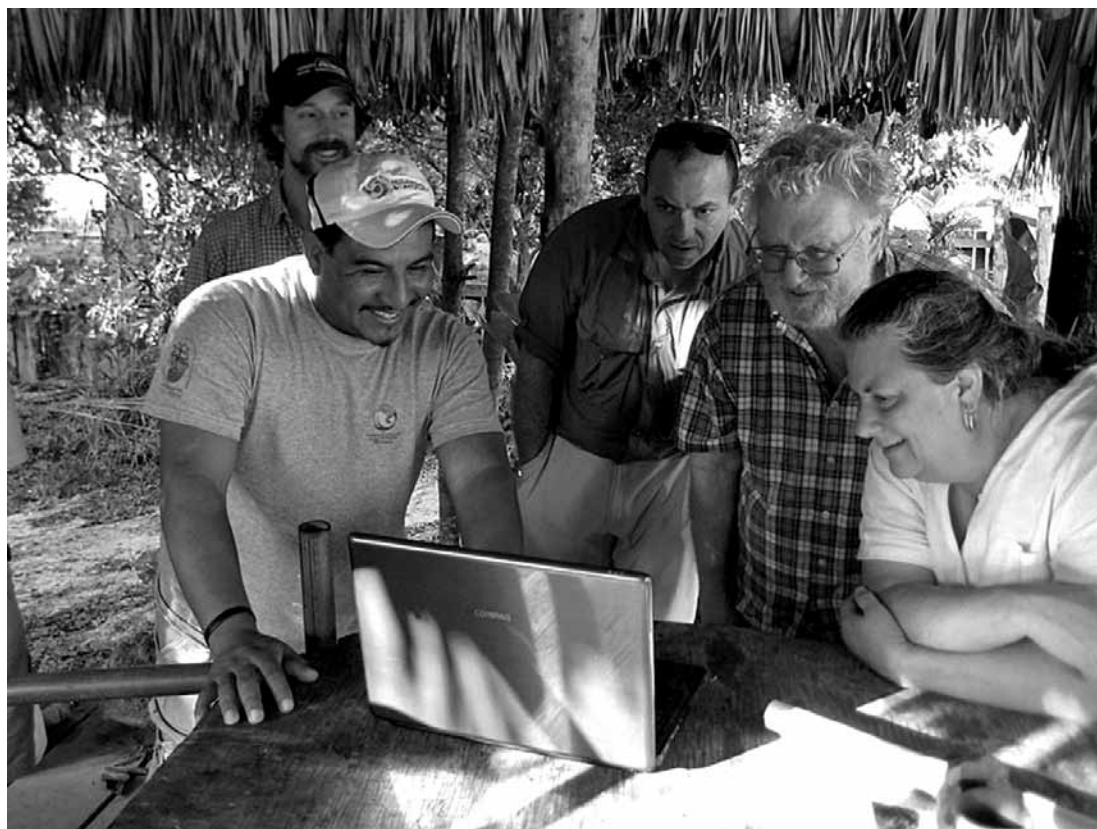
Figura 5. Foto de una cita con miembros de Puerta Verde y el PCE. Photo of a meeting between members of Puerta Verde and the PCE.

Puesto que buscamos fondos para apoyar esta tarea, existen pasos iniciales que podemos comenzar a realizar. Uno es darnos el tiempo para reunirnos con los representantes de todos los grupos actores del área (Figura 5). A medida que iniciamos un trabajo arqueológico más intensivo en la costa norte, debemos priorizar estas relaciones para encontrar qué es lo que ellos esperan obtener de nuestro estudio, limitar los malos entendidos acerca de nuestros objetivos de investigación y contemplar las necesidades de estos actores como una manera de ayudarnos a planear futuros proyectos. Otro paso a seguir es el desarrollo de una página web bilingüe (español e inglés) del PCE que incluya toda nuestra información de contacto, antecedentes acerca del proyecto de investigación y acceso a nuestros textos y reportes. Involucrar al sector educacional es otro camino que nos gustaría recorrer. Puede ser que lo anterior no abarque al total de los actores de manera colectiva pero cada caso puede tratarse individualmente para integrar a los grupos interesados.