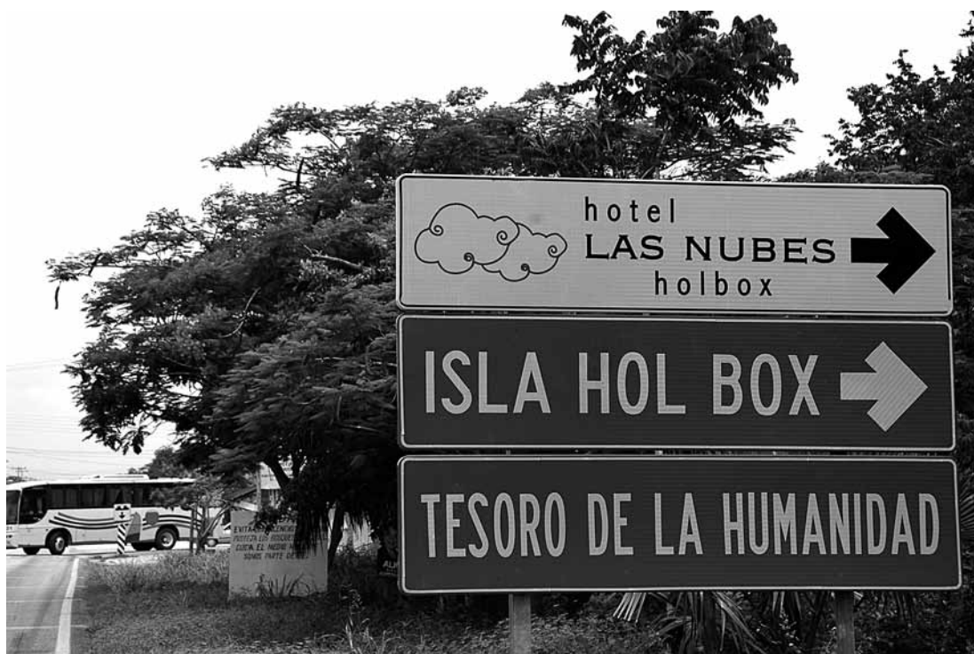
Figura 2. Anuncio publicitario reciente de la Isla Holbox. Recent sign advertising Isla Holbox.

El primero de los actores locales a tratar es la comunidad de Chiquilá, la cual es la puerta de entrada a la Isla Holbox y la comunidad con