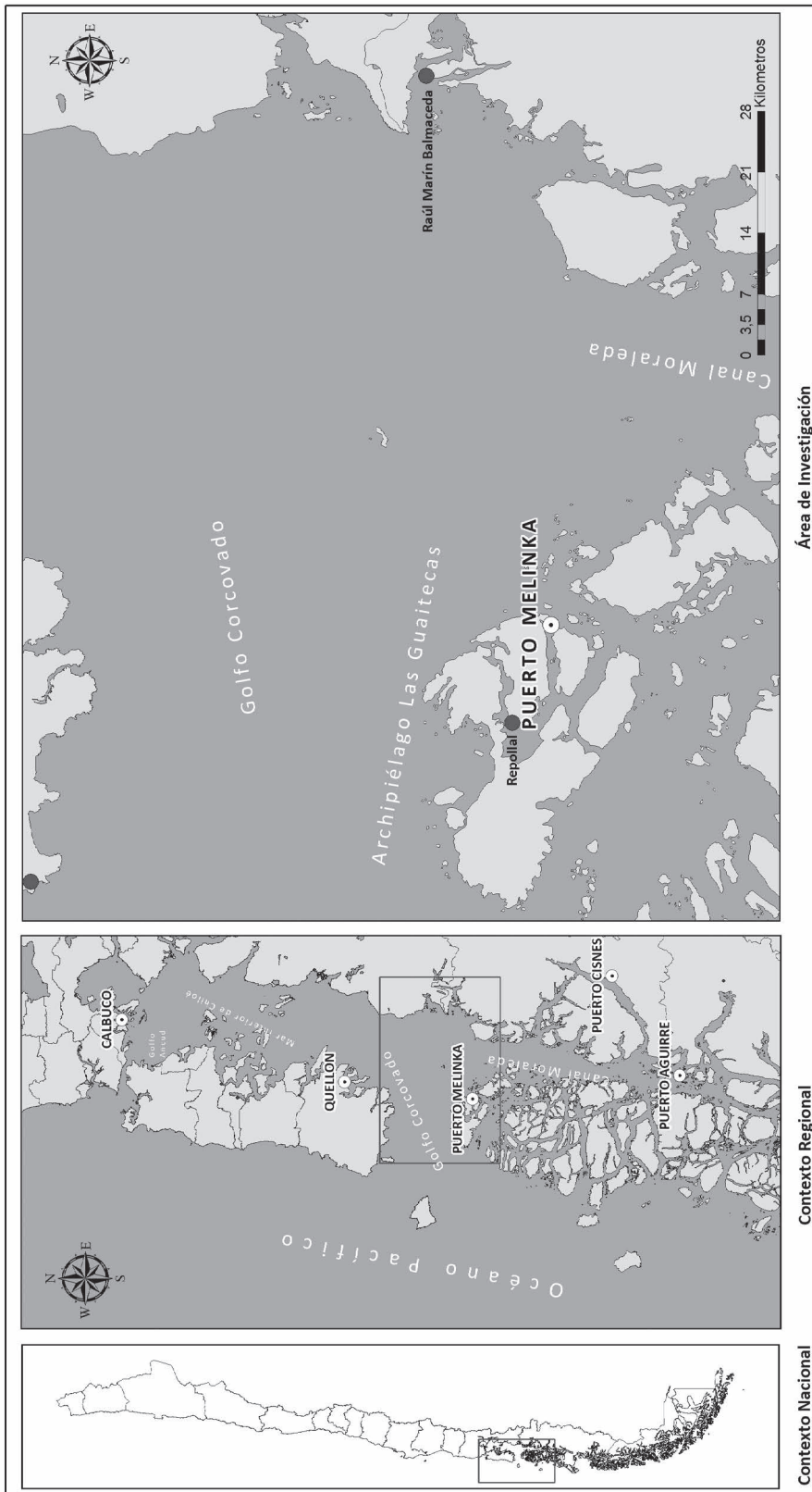
Figura 2. Puerto Melinka, Archipiélago de las Guaitecas. Elaborado por Zamir Bugueño. Puerto Melinka/Guaitecas archipelago . Prepared by Zamir Bugueño.