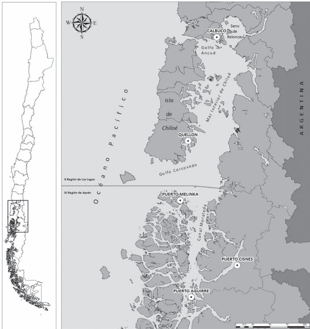
Figura 1. Sur Austral de Chile. Elaborado por Zamir Bugeño. Far south of Chile. Prepared by Zamir Bugeño.

emplazamiento territorial tiene particularidades que conviene destacar. En primer lugar, la baja densidad demográfica (sobre todo en Aysén), condición que permite pensar en un territorio prístino, prácticamente deshabitado, y que por lo mismo puede ser literalmente explotado y rentabilizado; segundo, la lógica de uso económico-productivo del territorio Sur Austral ha sido extractiva, sea por costumbres, por limitaciones geoclimáticas o bien por decisiones estratégicas. Chiloé parcialmente es la excepción, pues si bien allí también ha pesado