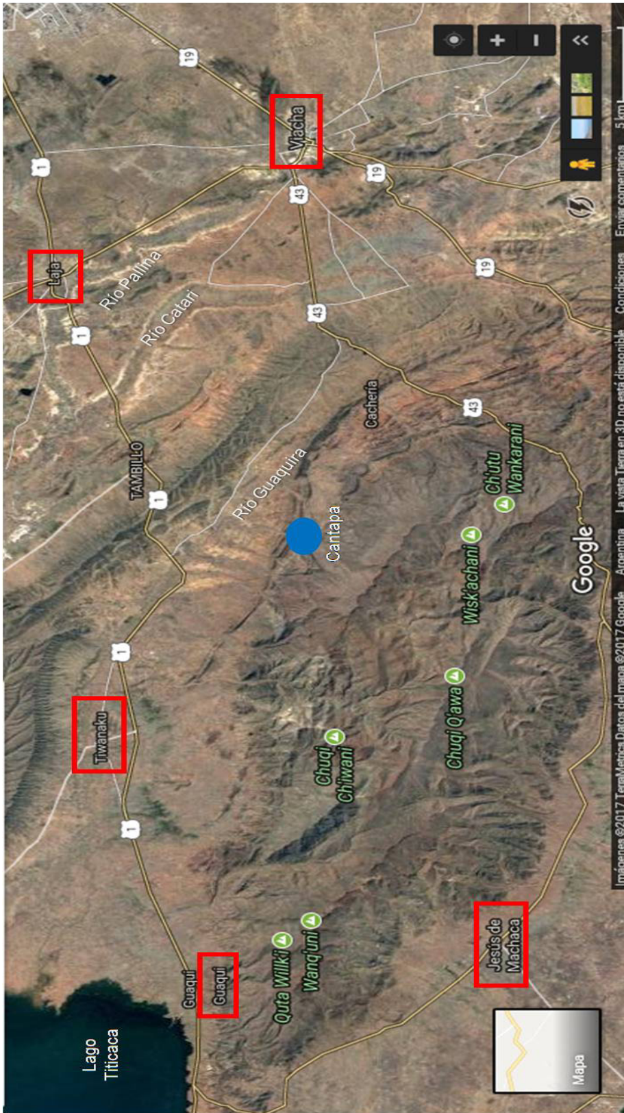
Figura 4. Ubicación de la estación Cantapa disputada entre los caciques de Laja y Guaqui. Elaboración personal. Location of station Cantapa, disputed among the caciques of Laja and Guaqui. Author's elaboration.