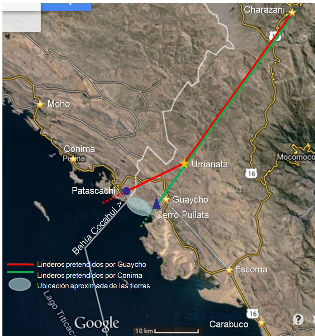
Figura 2. Ubicación aproximada de las tierras de Cacata, Capaquini y Cocavi disputadas entre los caciques de Conima y Guaycho. Elaboración personal.

Approximate location of the lands of Cacata, Capaquini and Cocavi, disputed among the caciques of Conima and Guaycho. Author's elaboration.