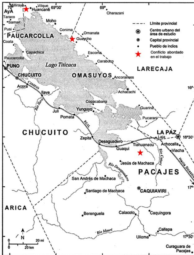
Figura 1. Conflictos por tierras abordados en el texto. Elaboración propia a partir de Thomson 2006:21. Conflicts over lands addressed in the text. Author's elaboration based on Thomson 2006:21.

Guaycho (corregimiento de Omasuyos) en un pleito por las tierras de Cacata, Capaqui y Cocavi 2 . Ubicadas a la vera del lago entre ambos pueblos, las chacras estaban destinadas al cultivo de papas para la elaboración del chuñu , al pastoreo de ganado y a la producción de pescado seco (Figura 2). La presencia de casas, cimientos y parcelas destinadas al cultivo denotaba una antigua ocupación y utilización productiva de los parajes disputados.