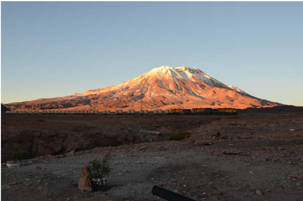
Figura 6. Vista del trazado ferroviario. Fotografía de Carolina Odone, junio 2017.

View of the train station. Photograph by Carolina Odone, June 2016.