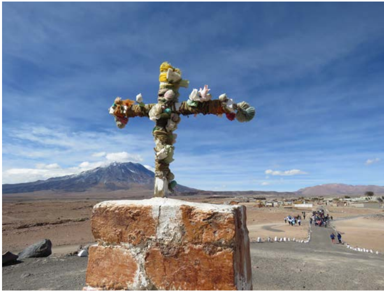
Figura 17. Vista de la procesión en el día grande de la fiesta. Fotografía de Carolina Odone, junio 2018.

View of the procession on the big day of celebration. Photograph by Carolina Odone, June 2018.