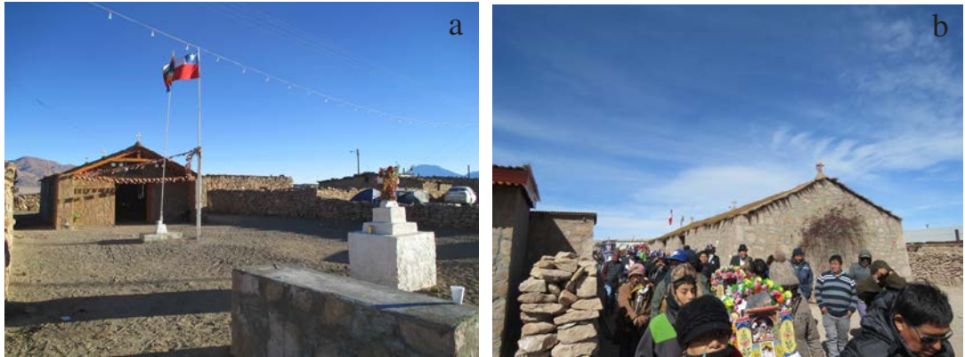
Figura 7. (a) La iglesia grande de San Pedro Estación. (b) Desde la iglesia grande de San Pedro Estación. Fotografías de Carolina Odone, junio 2017.

sociales, junto a sus cocinas comunitarias, aunque recientemente se construyó una tercera sede social levantada por una familia de la localidad.