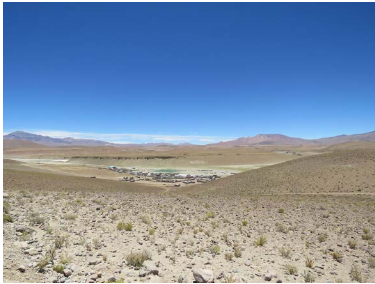
Figura 19. Vista de la localidad de Quetena Chica, Sur-López. Fotografía de Carolina Odone, diciembre 2018.

View of Quetena Chica, Sur-López. Photograph by Carolina Odone, December 2018.