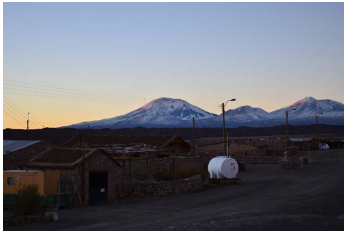
Figura 3. Vista de San Pedro Estación. Atrás se divisan los volcanes San Pedro y San Pablo. Fotografía de Carolina Odone, junio 2017.

View of the space around San Pedro Estación. Photograph by Carolina Odone, June 2017.