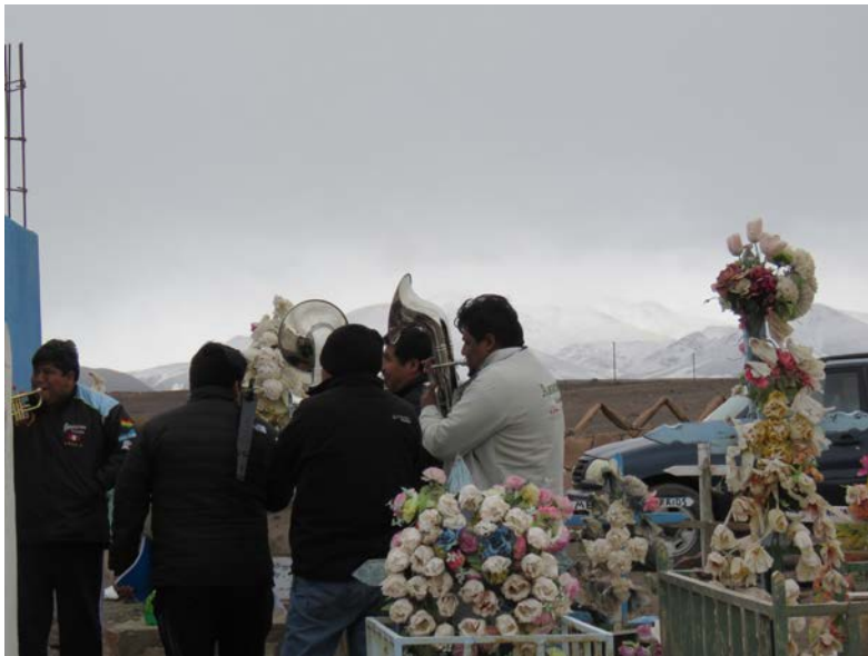
Figura 18. Para los que ya no están, desde el cementerio de San Pedro Estación. Fotografía de Carolina Odone, junio 2018.

View of the procession on the big day of celebration. Photograph by Carolina Odone, June 2018.