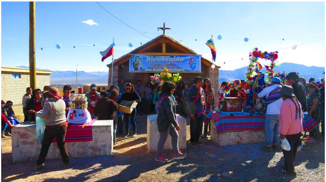
Figura 8. La iglesia chica o capilla de San Pedro Estación. Fotografía de Carolina Odone, junio 2017.

horizontal, dos puertitas rebatibles, decoradas con motivos florales, geométricos o con otras imágenes, aunque las flores son el motivo más extendido, las que se suelen combinar con motivos geométricos 2 .