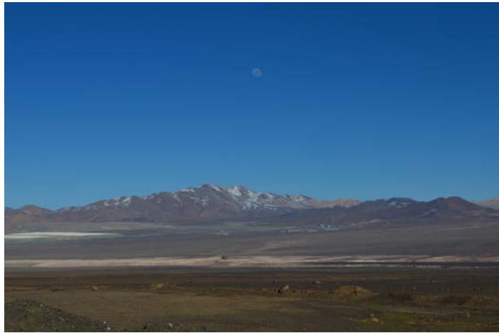
Figura 2. Vista del espacio en torno al poblado de San Pedro Estación. Fotografía de Carolina Odone, junio 2017.

View of the space around San Pedro Estación. Photograph by Carolina Odone, June 2017.