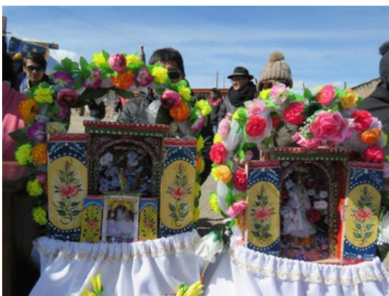
Figura 14. Las cajas de santos en el día grande de la fiesta. Fotografía de Carolina Odone, junio 2018.

Si estas manufacturas imbrican muchos ámbitos de la experiencia de las gentes indias,