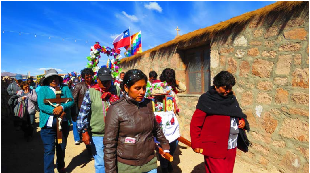
Figura 16. Las cajas de santos en andas. junio 2018.

memorias no sean olvidadas y que los habitantes dispersos de la localidad de San Pedro Estación sigan encontrándose cada 13 de junio, en el día grande de la fiesta de San Antonio de Padua (Figura 16).