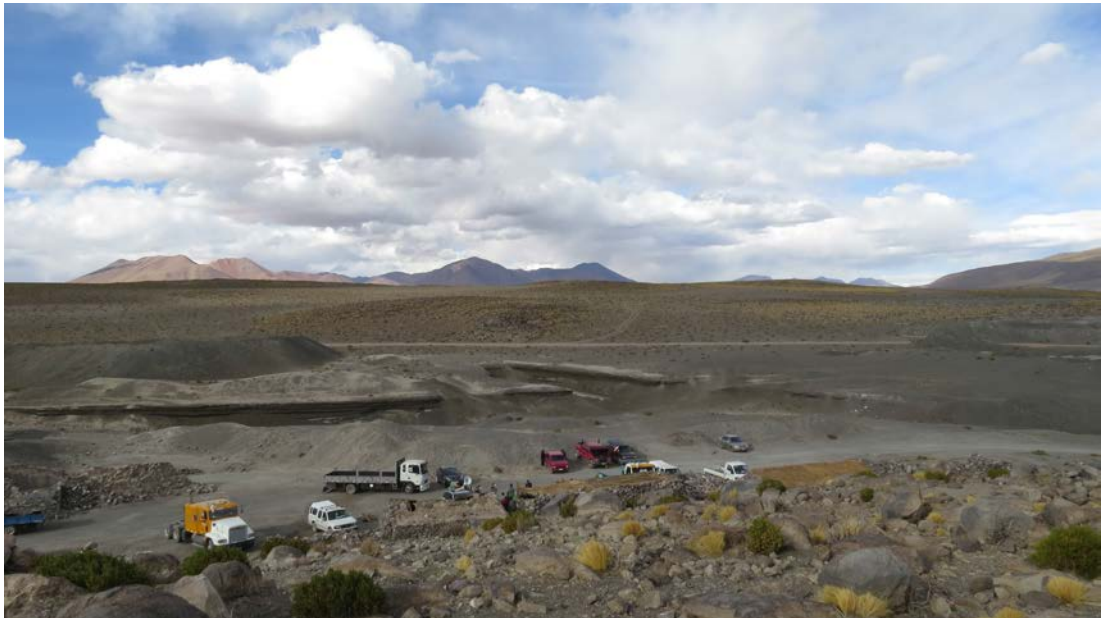
Figura 12. Vista actual de Ojos de San Pedro. Fotografía de Carolina Odone, junio 2017.

Current view of Ojos de San Pedro. Photograph by Carolina Odone, June 2017.