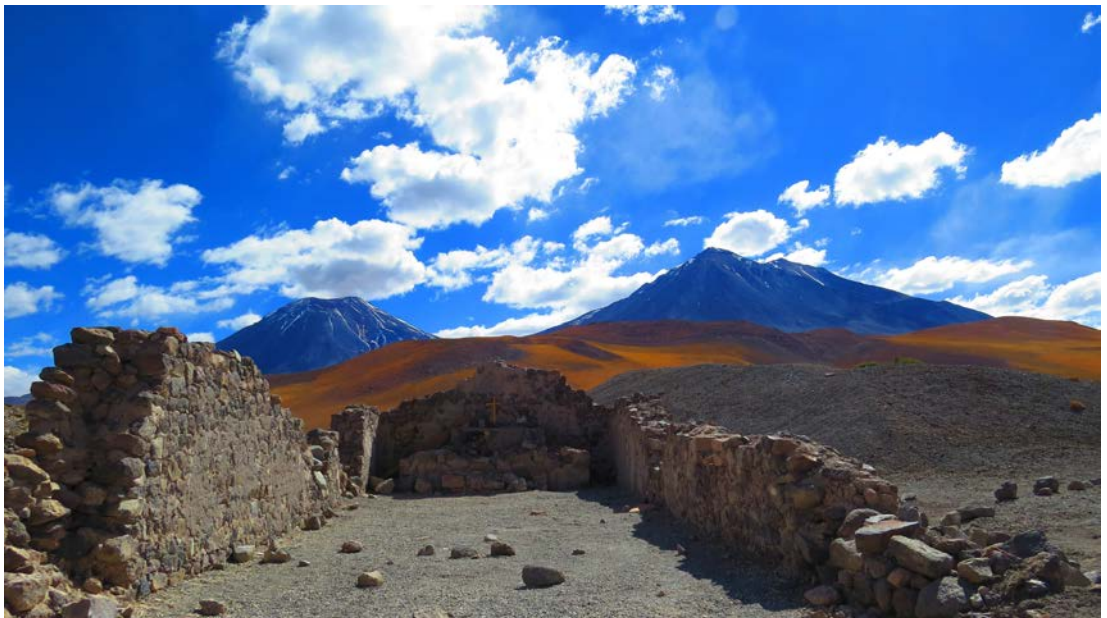
Figura 13. Vista de la iglesia destruida de Ojos de San Pedro. Fotografía de Carolina Odone, junio 2017.

Current view of Ojos de San Pedro. Photograph by Carolina Odone, June 2017.