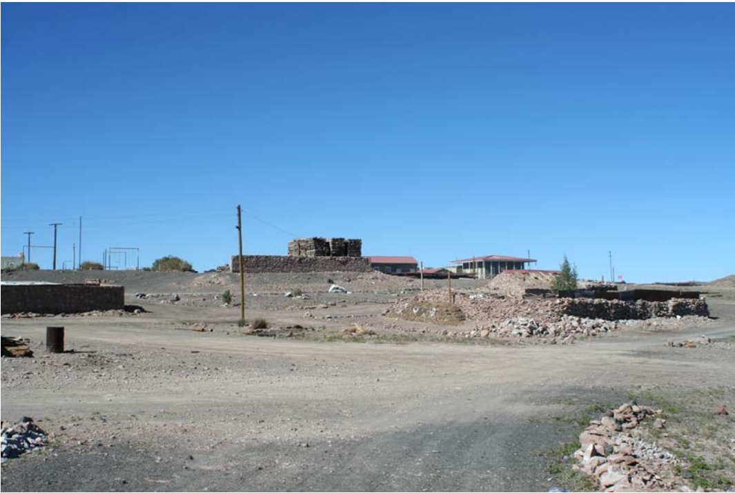
Figura 5. Vista de la estación de trenes. Fotografía de Carolina Odone, junio 2016.

View of the train station. Photograph by Carolina Odone, June 2016.