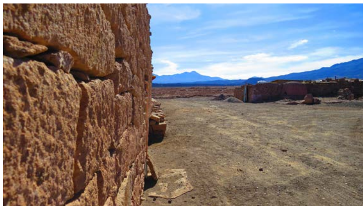
Figura 4. Vista de San Pedro Estación. Fotografía de Carolina Odone, junio 2017.

View of San Pedro Estación. Behind you can see the San Pedro and San Pablo volcanoes. Photograph by Carolina Odone, June 2017.