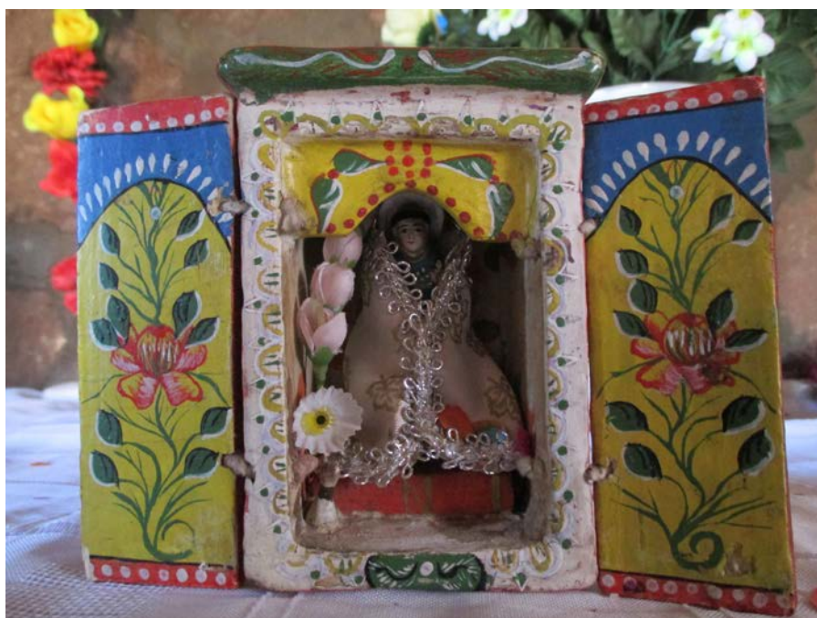
Figura 1. Vista de una caja de madera de San Antonio de Padua. Fotografía de Carolina Odone, junio 2017.

View of a wooden box of San Antonio de Padua. Photograph by Carolina Odone, June 2017.