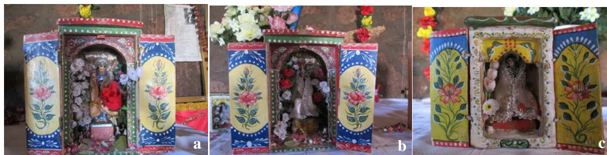
Figura 10a, b y c. Vista de las cajas de madera de la iglesia chica o capilla. Fotografías de Carolina Odone, junio 2017.

Las características estéticas y formales referidas permiten proponer que las seis cajas de San Pedro Estación encajan dentro del corpus de objetos cajas de Bolivia, y por ende proceden de una factura propia de los Andes bolivianos.