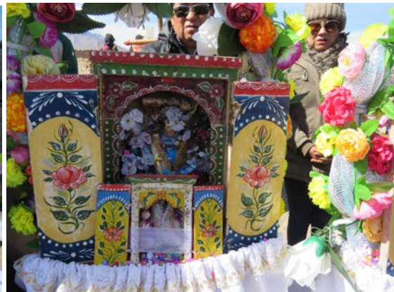
Figura 15. Las cajas de santos en el día grande de la fiesta. Fotografía de Carolina Odone, junio 2018.

The boxes of saints on the big day of the celebration. Photograph by Carolina Odone, June 2018.