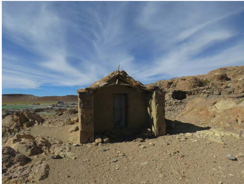
Figura 20. La capilla de don Emilio Esquivel en Quetena Chica, Sur-López. Fotografía de Carolina Odone, diciembre 2018.

View of Quetena Chica, Sur-López. Photograph by Carolina Odone, December 2018.