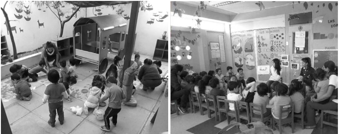
Figura 2. Realización de actividad de lectura compartida y reproducción de pictografías con niños y niñas en el año 2015.

Shared reading and reproduction of pictographs with children in 2015.