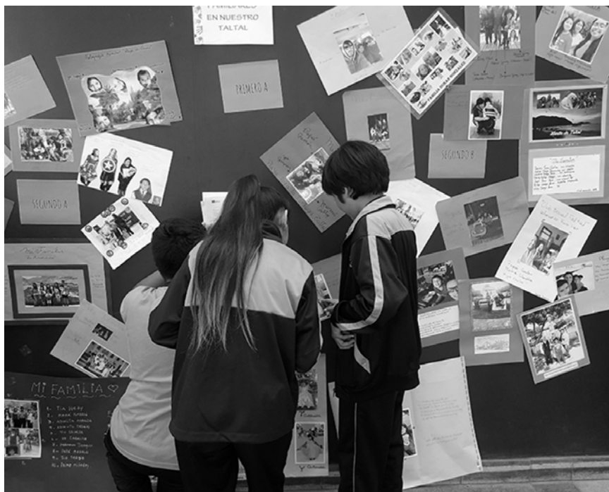
Figura 3. Exposición final actividades de “Momentos más importantes de mi vida” y “Árbol de Familia” en 2017.

En el transcurso de 10 semanas, se realizaron un total de cinco experiencias de aprendizaje y una visita al museo por curso. Las actividades incluyeron lecturas compartidas, cuentos valóricos de cuidado del patrimonio, principios alfabéticos, actividades de clasificación, segmentación silábica, entre otras (Figura 3). Cada curso recibió su propio kit de recursos didácticos para que pudieran seguir implementándose las actividades a largo plazo.