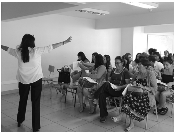
Figura 4. Jornada de co-construcción de la iniciativa con Educadoras de Párvulos y profesoras locales de la Comuna de Taltal, Proyecto Explora ED21029.

En esta etapa del proyecto la comunidad educativa local participó en la co-creación de la propuesta pedagógica, así como en la selección de los recursos didácticos más adecuados a los objetivos de la misma. Para ello, se realizaron diversas jornadas de diálogo, discusión y transposiciones didácticas (Figura 4) de conocimientos académicos y no académicos sobre la realidad local, estrategias didácticas y sobre la misma propuesta pedagógica en su conjunto, incluyéndose salidas a terreno, visitas al museo y talleres conjuntos.