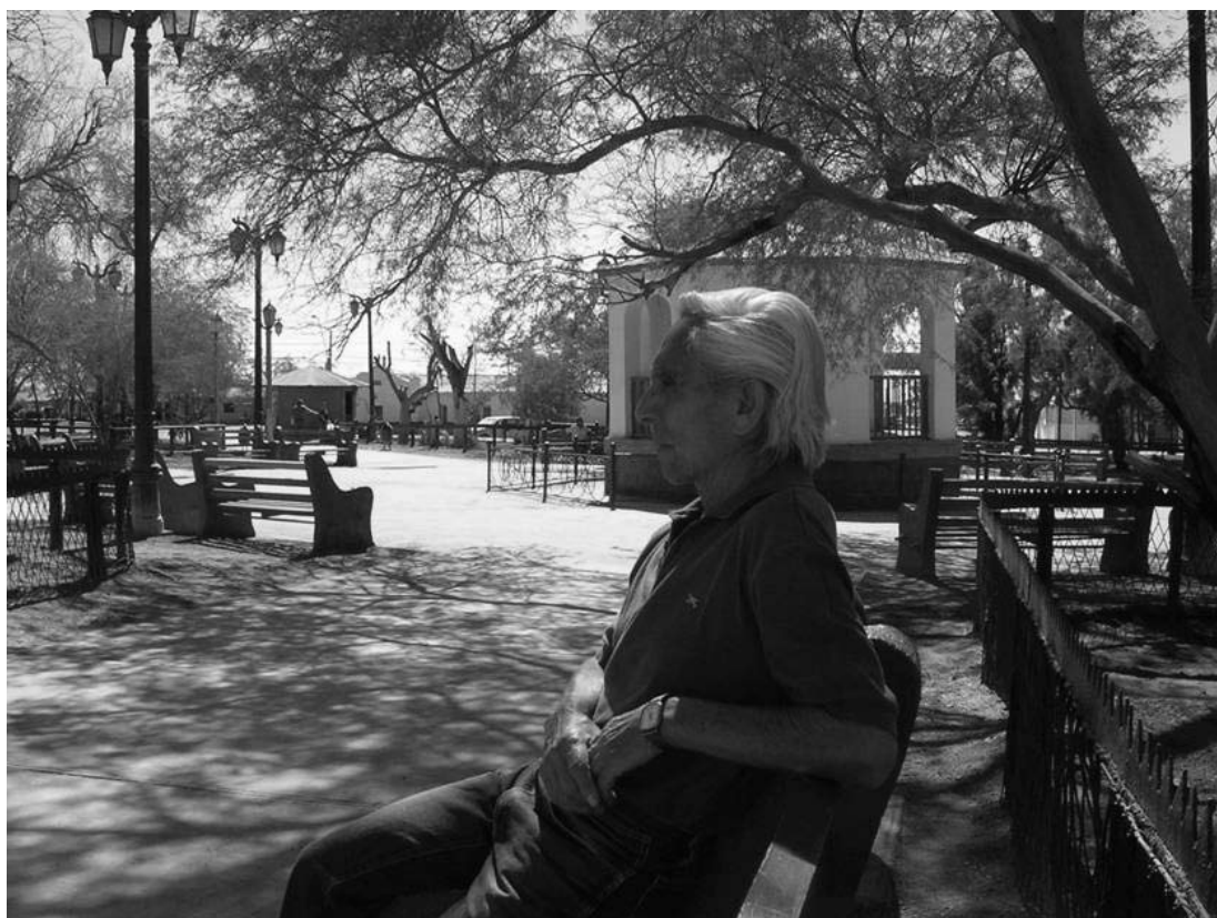
Figura 2. Plaza de María Elena. María Elena Square .

de clausura al mundo. Pero también se vuelve perpetua y reiterativa la apelación a las instancias asistenciales, tanto en demandas cotidianas hacia la empresa SQM, a la que se siente y se piensa aún como benefactora (casi como el padre piadoso), como en apelaciones al municipio que representa la presencia del Estado.