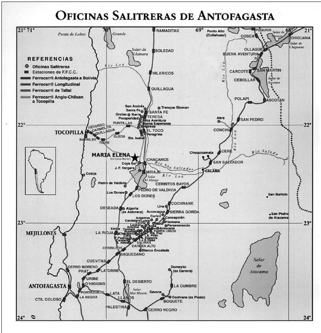
Figura 1. Mapa de la zona, tomado de álbum desierto. Map of the area, taken from album desert.

deben entenderse como fluctuantes, imprecisos y con claras tendencias a decrecer. Los censos hablan de que en 1930 la habitaban 9.062; en 1940, 9.198; en 1952, 9.686, y en 1960, 9.572 (González Pizarro 2003:274). En 1992 se estimaban 13.660; en 1996, 9.583, y en el año 2000, sólo 7.475 2 .