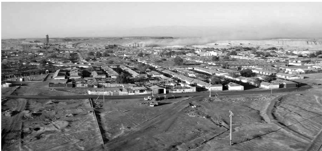
Figura 4. Vista panorámica de María Elena. Overview of María Elena.

Es esta misma abertura, este juego de mecanismos de expulsión y atracción, lo que indica que el